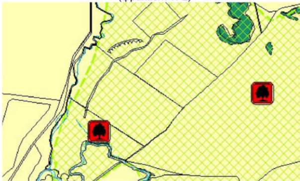
Карта функциональных зон (фрагмент №2)